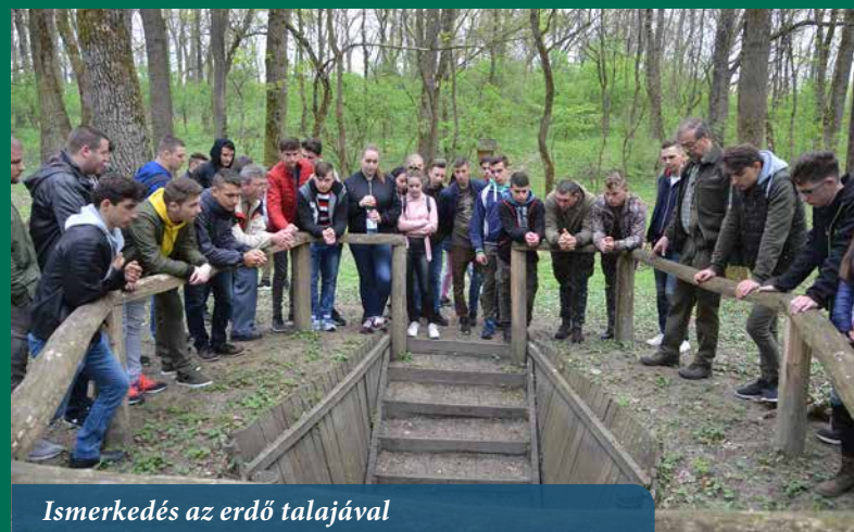
Ismerkedés az erdő talajával