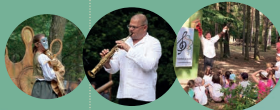
A programváltoztatás jogát fenntartjuk.

Vasárnap ingyenes buszjárat indul az újvárosközponttól a Püspökfürdőben található hullámfürdőig és ingyenes mikrobuszjárat a püspökfürdői Ceres illetve Perla szállók mellől.