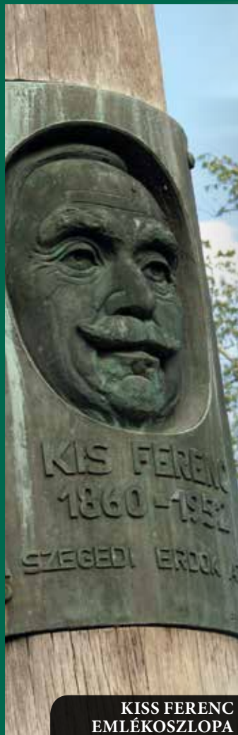
KISS FERENC EMLÉKOSZLOPA

Az ásóthalmi erdők felfedezőinek érdemes megtekinteniük a Bajára vezető főút 36. kilomé-